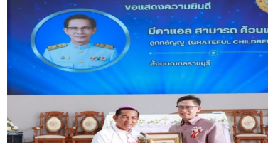
ขอแสดงความยินดี มีคาแอล สามารถ ค้วนเครือ ลูกกตัญญู (GRATEFUL CHILDREN) สังฆมณฑลราชบุรี