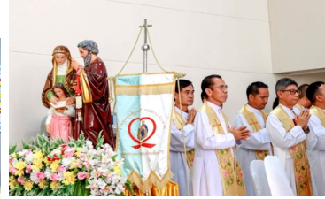
ระหว่างเพลงปิดพิธี