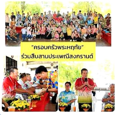
"ครอบครัวพระหฤทัย" ร่วมสืบสานประเพณีสงกรานต์